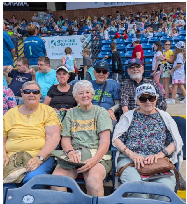
Residentes de Givens Estates en un juego de los Asheville Tourists.