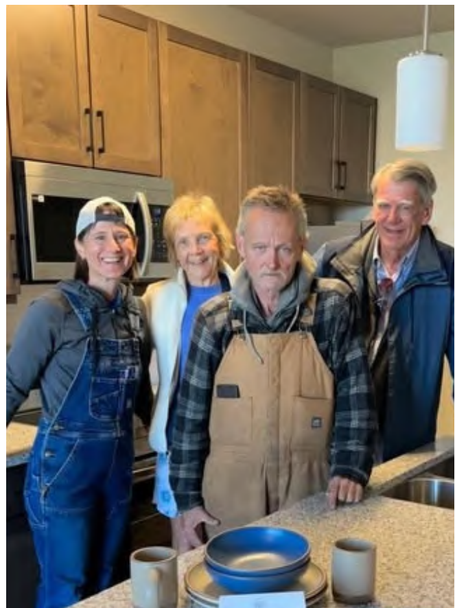
Nuevo inquilino y personal de Lady Gloria Ridge.

Haywood Street Community Development se formó en 2020 para desarrollar viviendas asequibles vinculadas a los ministerios y programas existentes de Haywood Street que ya brindan servicio. Givens Communities es socio de Haywood Street Community Development y administra los apartamentos asequibles.