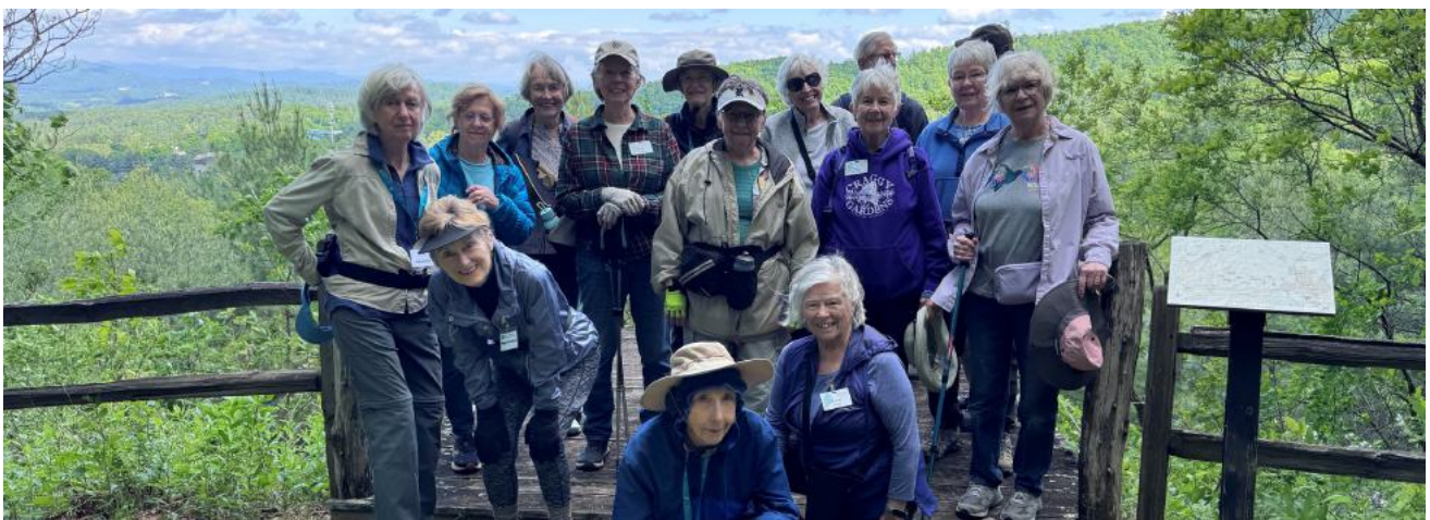
Grupos de senderismo de Givens Highland Farms y Givens Estates se reúnen para un día en el sendero.