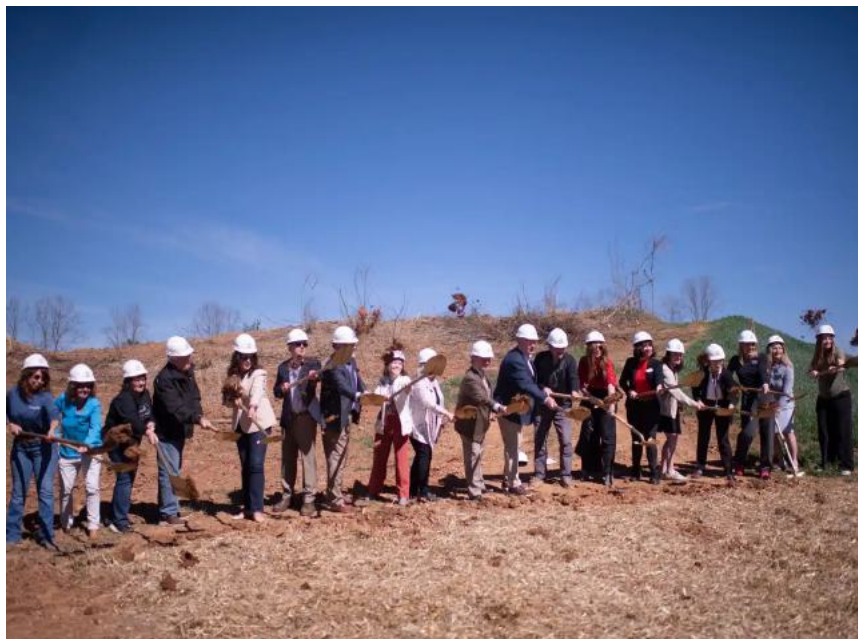
Líderes de Givens Communities y del condado de Henderson dan inicio a la obra juntos en el sitio de Apple Ridge.

“En Givens, vemos la vivienda asequible para adultos mayores no como un proyecto aislado, sino como una prioridad regional”.