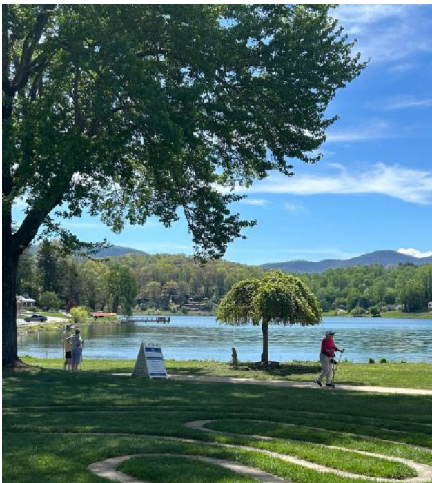
Residentes de Givens Estates visitan Lake Junaluska.