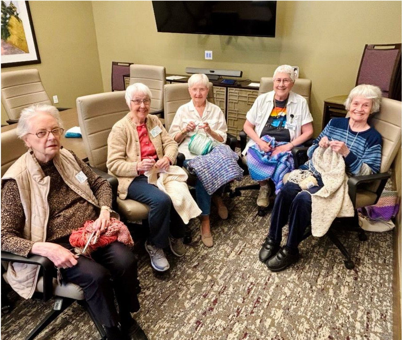
El grupo Charity Knitting & Crochet en Givens Highland Farms.

Algunos residentes de Givens Highland Farms y Givens Estates están convirtiendo las artes textiles en una poderosa fuerza de conexión, creatividad y servicio comunitario.