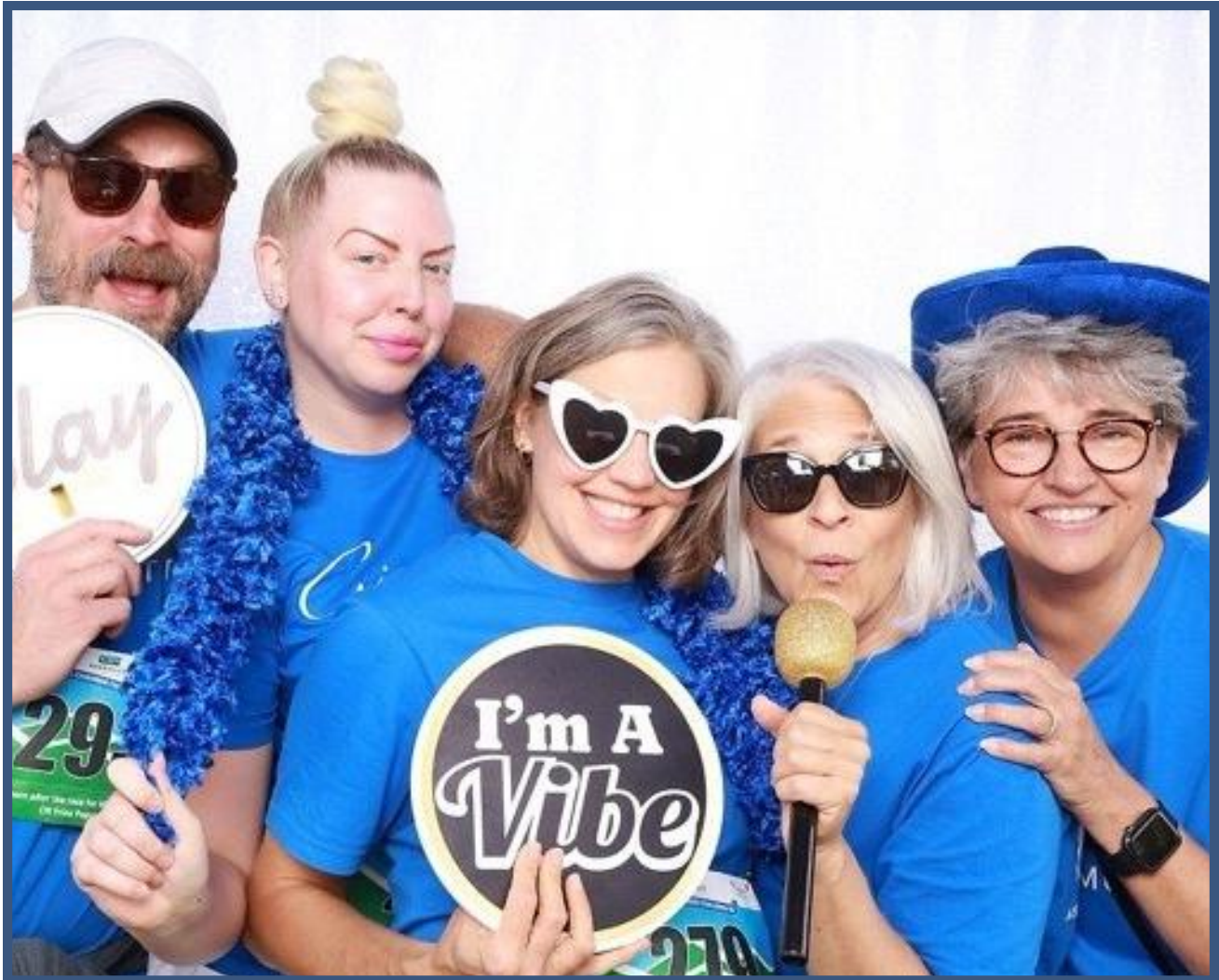
Equipo de Givens Foundation en un momento ameno durante la carrera Asheville Chamber Challenge 5K.

En un importante anuncio, Givens Philanthropy pasará a llamarse Givens Foundation, un nombre que refleja con mayor claridad su papel fundamental en el avance de la misión y la ampliación del impacto del equipo de filantropía de Givens.